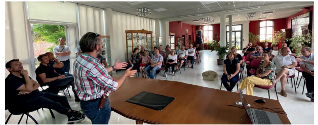
Les riverains de la rue Berthelot ont été conviés à une réunion de présentation du projet. Ils ont pu exprimer leurs interrogations auprès des opérateurs présents.

Cette seconde phase verra la pose d'une canalisation d'un mètre soixante de diamètre destinée à capter le plus gros des eaux usées en amont et éviter un déversement dans la partie basse de la rue, avec les nuisances notamment olfactives que peuvent connaître les riverains aujourd'hui. Et nécessitera l'ouverture d'une tranchée de 2,50 mètres.