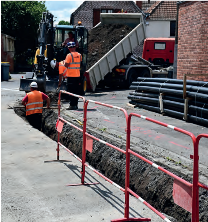
Dans le cadre des travaux d'amélioration du réseau de distribution d'eau potable, L'Eau du Valenciennois procède actuellement au renouvellement des branchements et de la canalisation d'eau potable rue Giraud. Les travaux ont débuté le 19 juin dernier, pour une durée de neuf semaines.