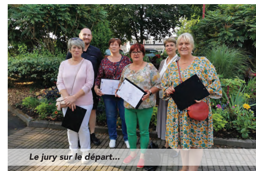
Le jury sur le départ...