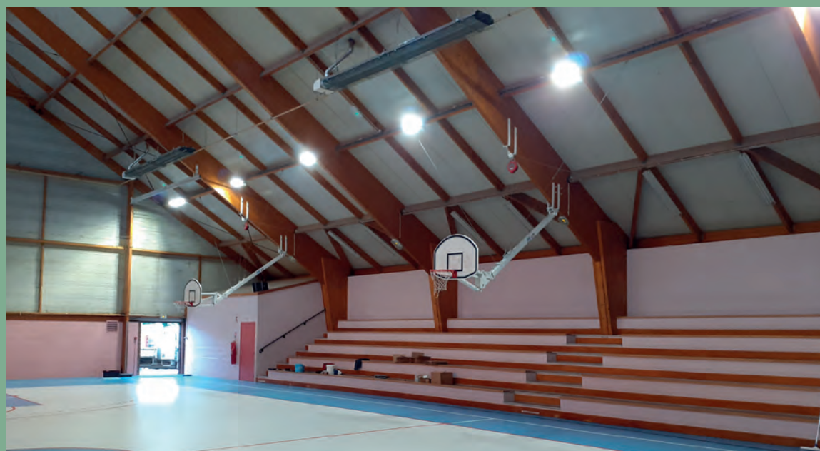
Après la salle des fêtes, le stade Georges Cliquet, la salle Daniel Colmont (photo ci-dessus), la Ville poursuit le remplacement des éclairages de ses bâtiments et équipements municipaux par de l'éclairage LED. Courant juillet, la salle Lancelin sera ainsi équipée à son tour.

Bravo et merci à tous pour leur participation à cet effort collectif, et cette solidarité dont les Onnaingeoises et Onnaingeois sont coutumiers !