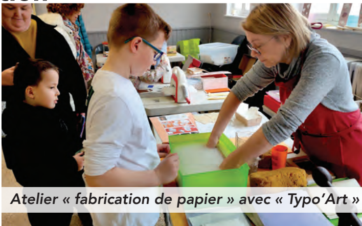
Atelier « fabrication de papier » avec « Typo'Art »