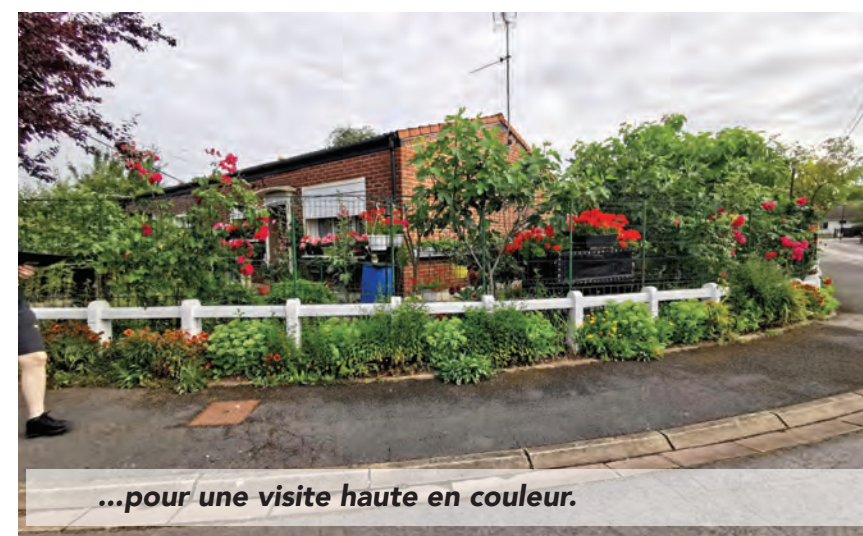
...pour une visite haute en couleur.

Chaque mercredi matin, les bénévoles de l'atelier Potager de la Maison Pour Tous Fabien Thiémé s'adonnent aux joies du jardinage.