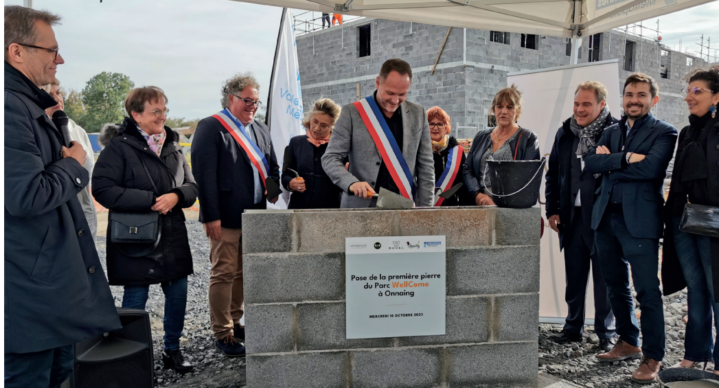
Première pierre de l'hôtel B&B sur le PAVE II