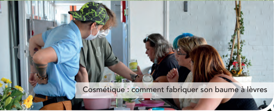
Cosmétique : comment fabriquer son baume à lèvres