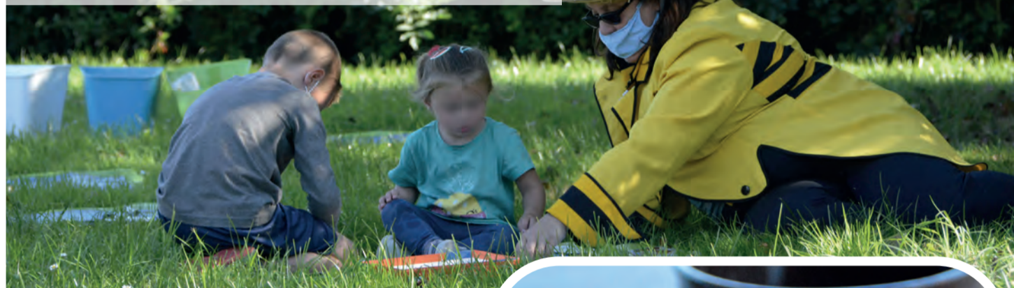
Sensibilisation des enfants à la protection de la nature