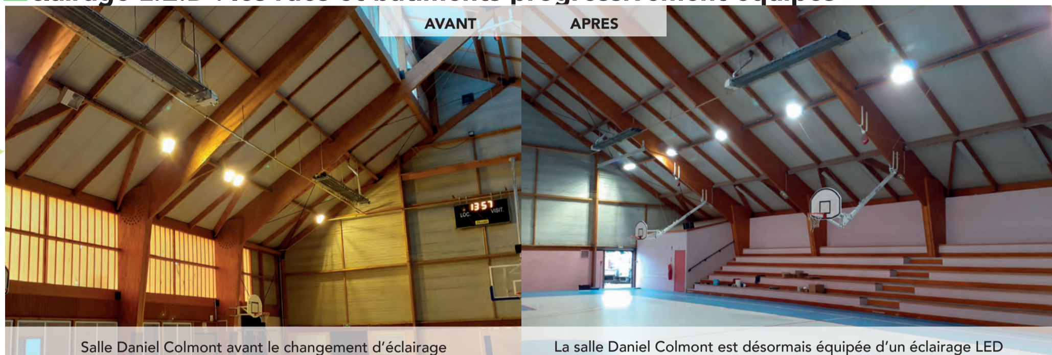
Salle Daniel Colmont avant le changement d'éclairage