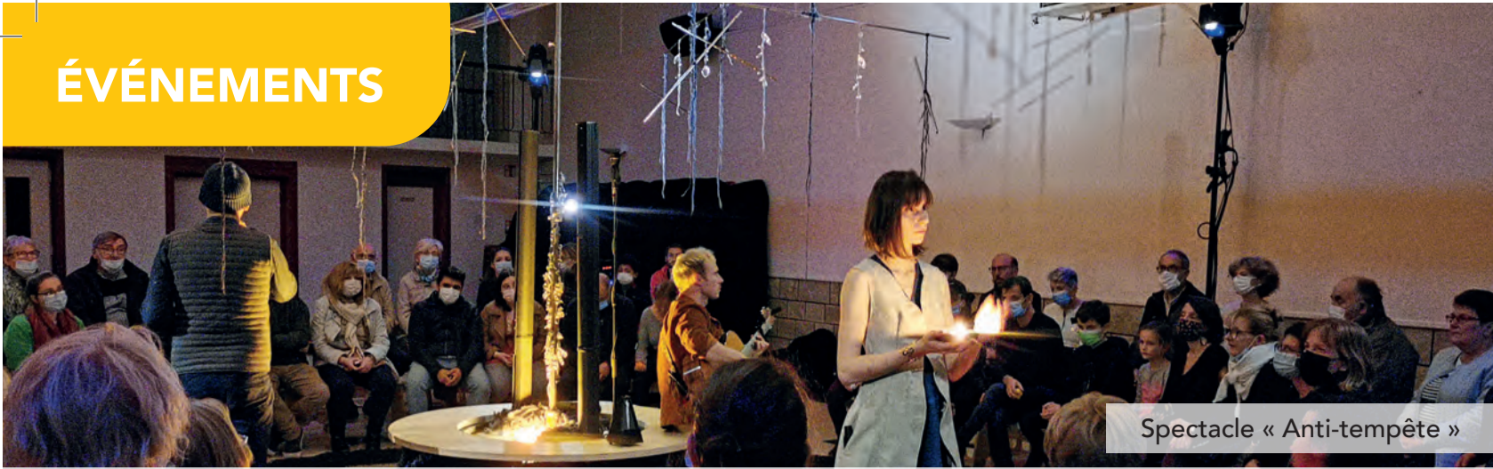
Spectacle « Anti-tempête »