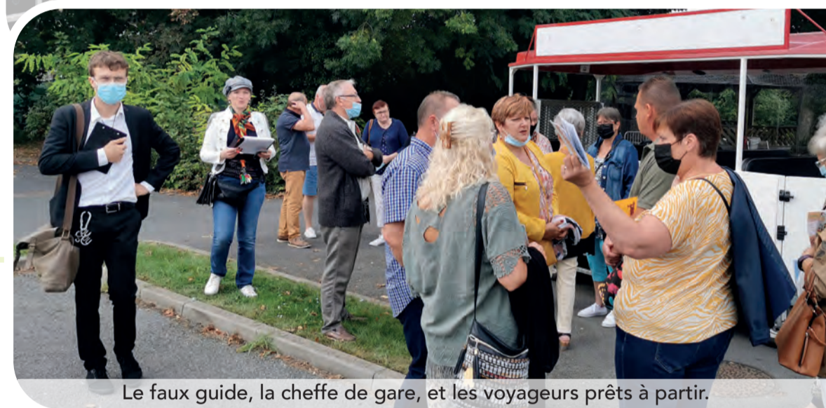
Le faux guide, la cheffe de gare, et les voyageurs prêts à partir.