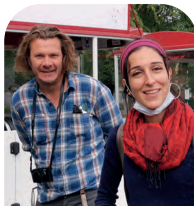
Les trublions à l'accent « marseillais »

Si vous n'avez pas pu participer à ces journées du patrimoine vous pouvez réaliser le parcours de la visite en famille ou entre amis en retrouvant l'itinéraire et le petit guide sur votre site à l'adresse suivante : www.onnaing.fr/loisirs/biblio-victor-hugo/la-phototheque .