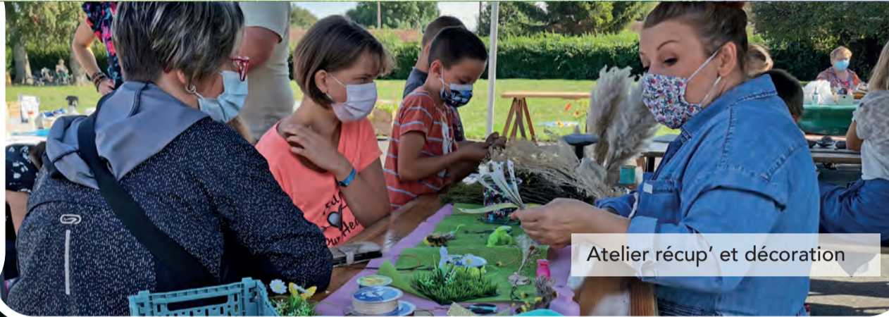
Atelier récup' et décoration