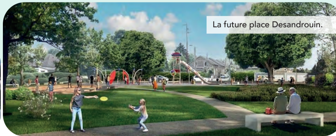
La future place Desandrouin.