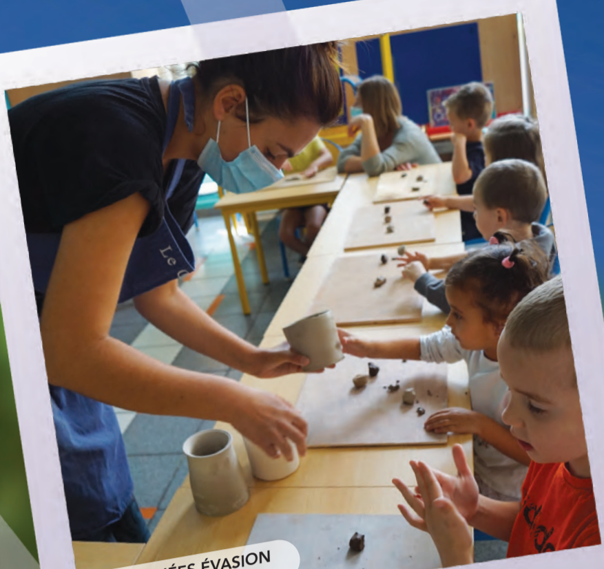
JOURNÉES ÉVASION Initiation poterie