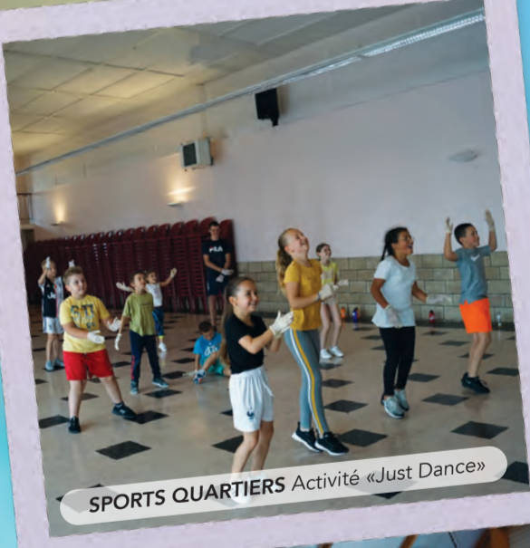
SPORTS QUARTIERS Activité «Just Dance»