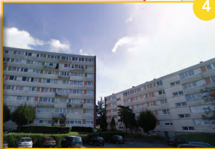
Travaux Cité du Stade

Le partenariat entre la Municipalité et la SIGH a permis la préparation active d'un projet de réhabilitation de la résidence du Stade. Les locataires ont reçu ce mois-ci un courrier personnalisé concernant la rénovation de leur logement. En collaboration avec le SIAV, la ville et le bailleur prévoient également l'aménagement de la place donnant aux immeubles avec création d'un vrai parking. Les travaux débiteront d'ici la fin d'année 2021.