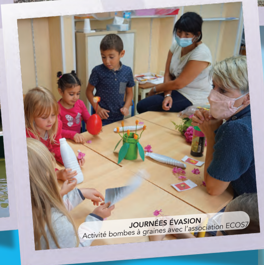
JOURNÉES ÉVASION Activité bombes à graines avec l'association ECOS7