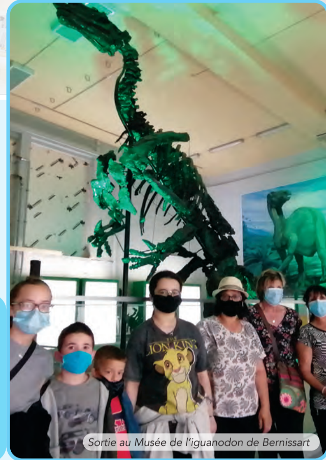
Sortie au Musée de l'iguanodon de Bernissart