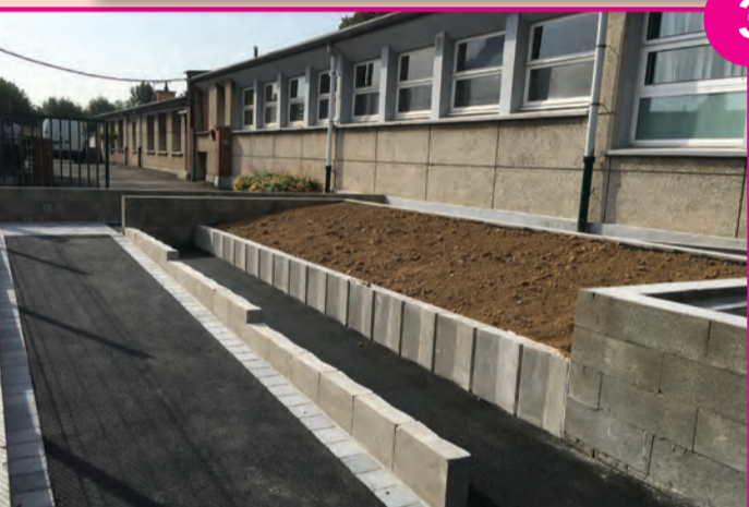
Réfection totale de l'accès de l'école Jacques Prévert

Dégradé par le temps et les intempéries, l'escalier d'accès à l'école maternelle Prévert a été remplacé par la construction d'une rampe en pente douce. Cela a permis de créer un accès PMR pour cette école tout en offrant aux tout-petits une entrée plus facile dans leur école.