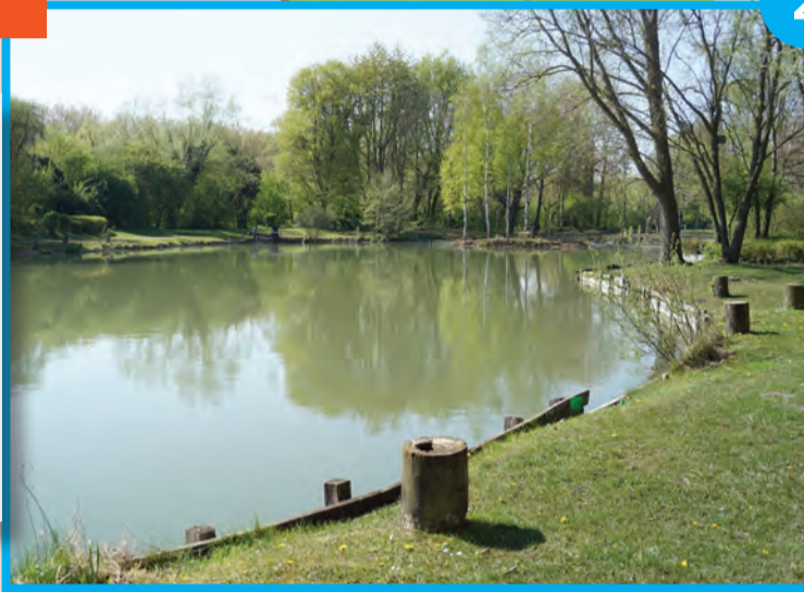
Suite et fin de la réfection des berges de l'étang

Comme elle s'y était engagée, la Municipalité poursuit la réfection des berges de l'étang, à raison de 100 mètres linéaires par an. Une opération réalisée afin de préserver ce lieu de promenade et offrir aux pêcheurs des conditions idéales pour pratiquer leur loisir favori. L'association de pêche s'est engagée à entretenir et nettoyer les berges tout au long de l'année.