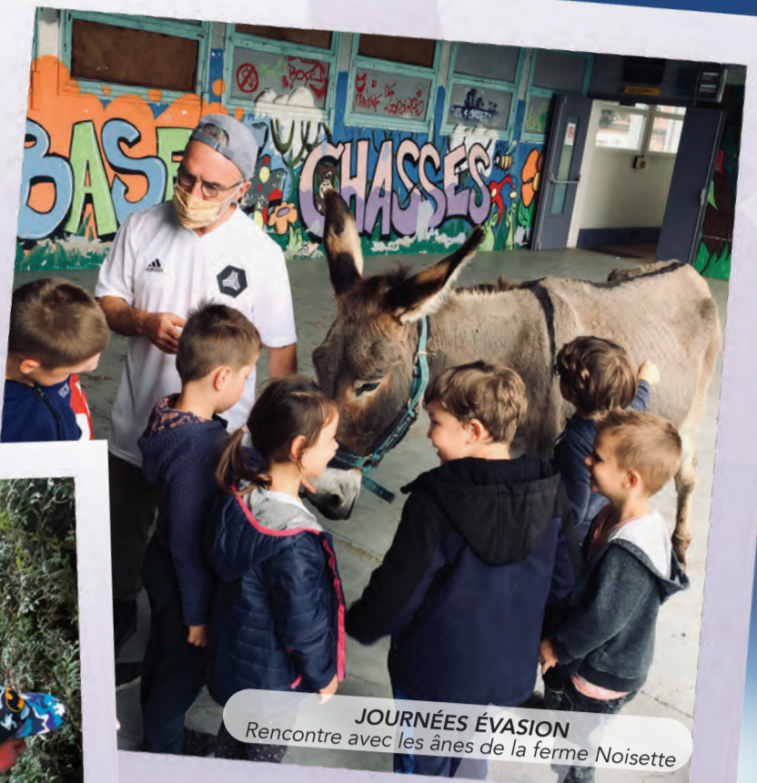
JOURNÉES ÉVASION Rencontre avec les ânes de la ferme Noisette