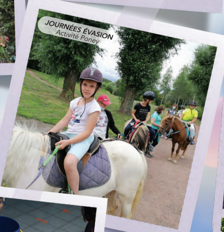
JOURNÉES ÉVASION Activité Poney