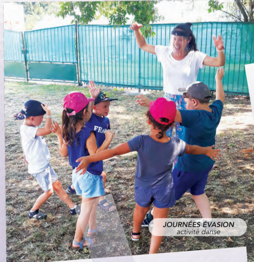
JOURNÉES ÉVASION activité danse