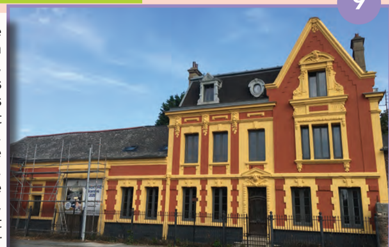
Suite des travaux à la Brasserie Mochez