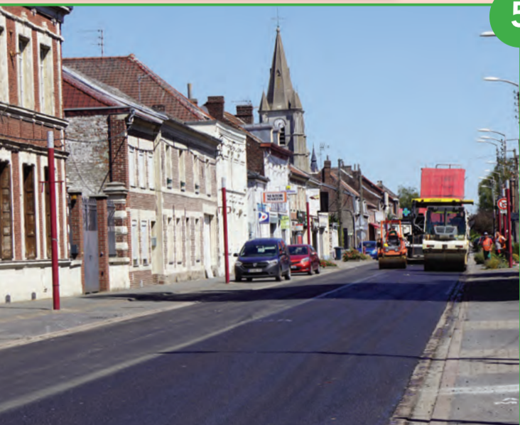
Réfection totale de la rue Jean Jaurès

La rue Jean Jaurès a bénéficié de la pose d'un nouvel enrobé. Le département a été sollicité par la ville afin de créer un rond-point à l'intersection de la rue Jean Jaurès et de la rue du 14 juillet. Cette rénovation progressive de l'axe principal commerçant de la ville d'Onnaing, participe activement au renouveau du centre-ville (voir pages 4 et 5). Le projet Coeur de Ville et la dotation obtenue de la région pour la redynamisation du centre-ville conforteront encore le développement de notre commerce local.