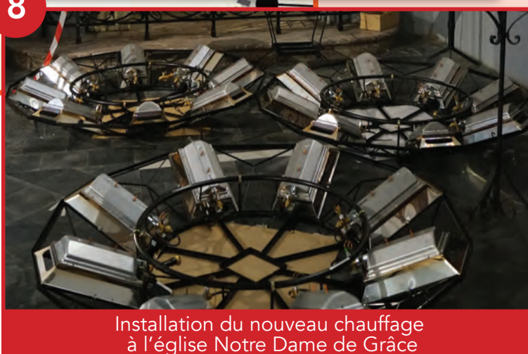
Installation du nouveau chauffage à l'église Notre Dame de Grâce

Ultime étape de cette première phase de rénovation de l'église Notre Dame de Grâce, l'installation du nouveau chauffage par radiant, afin de permettre à la paroisse d'accueillir les événements culturels dans de bonnes conditions, à quelques mois de la saison hivernale.