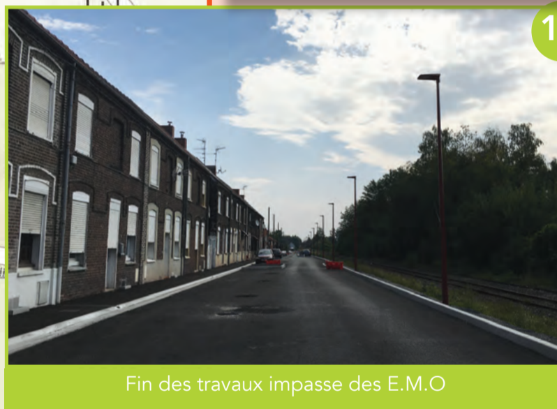
Fin des travaux impasse des E.M.O