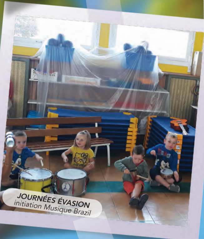
JOURNÉES ÉVASION initiation Musique Brazil