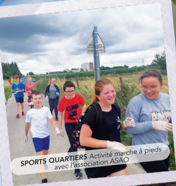
SPORTS QUARTIERS Activité marche à pieds avec l'association ASAO