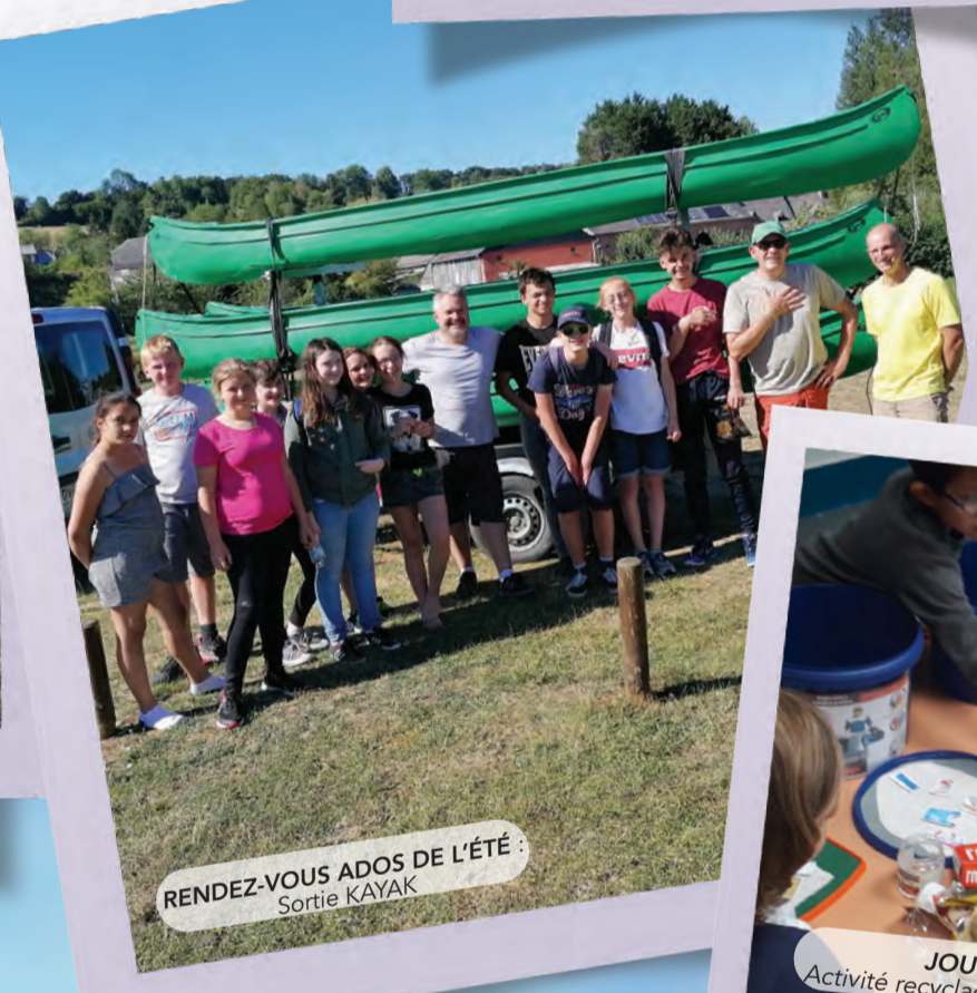
RENDEZ-VOUS ADOS DE L'ÉTÉ : Sortie KAYAK