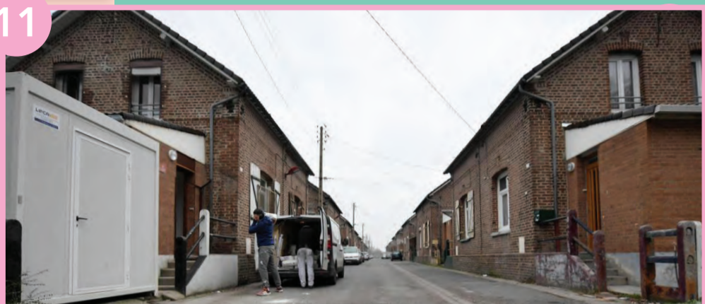
Rénovation de la cité Cuvinot

La démarche entamée pour la rénovation de la cité Cuvinot suit son cours. Une réunion publique sera organisée le vendredi 2 octobre à 18h à la salle des fêtes concernant la rénovation des 414 logements et l'aménagement des espaces publics. Cette nouvelle étape fait suite au diagnostic réalisé par les bailleurs sociaux. Parallèlement, un travail de cohésion sociale est entamé pour accompagner les habitants durant la durée de cette rénovation de la cité minière, suivi par Mélanie Cinari, adjointe à la rénovation de la Cité Cuvinot. La réhabilitation des logements doit débuter en 2021.