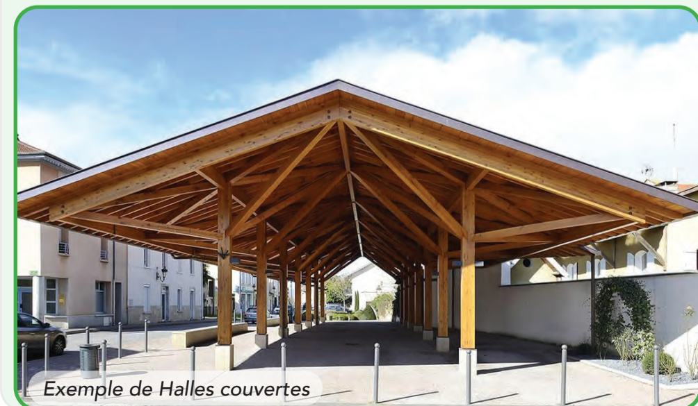
Exemple de Halles couvertes

La Municipalité organisera parallèlement une réunion publique ouverte à tous les Onnaingois. La date de cette réunion sera diffusée sur le site internet de la ville et par voie d'affiche en mairie.