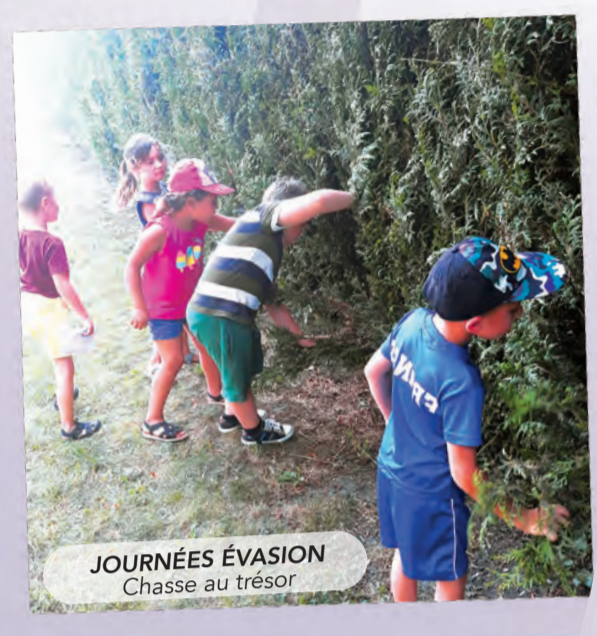
JOURNÉES ÉVASION Chasse au trésor