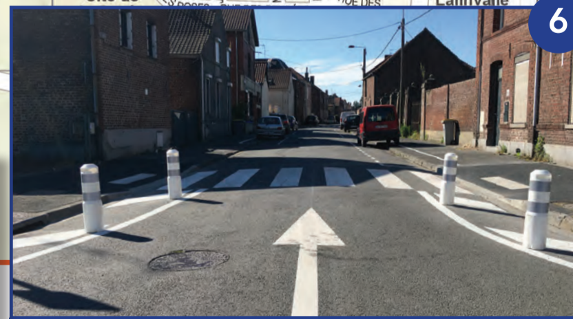
Création d'une rue à sens unique rue Scouflaire

Fruit de l'implication et de la concertation débutée en octobre 2019 avec les riverains de cet axe réputé dangereux, l'aménagement et la sécurisation de la rue Scouflaire ont été réalisés dès le mois de juillet. Des dos d'âne ont été installés, des passages piétons et des zones de stationnement ont été créés.