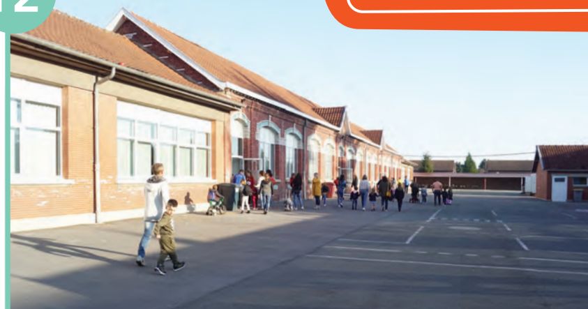
Construction et réaménagement d'écoles à Cuvinot

Travaillé en concertation avec les enseignants et les représentants des parents d'élèves, ce projet de plusieurs millions d'euros est désormais soumis à un concours d'architectes, puis à appel d'offre des entreprises et recherche de subventions. Une réunion publique de présentation pourra ensuite être organisée. Les écoles devraient être opérationnelles pour la rentrée 2022.