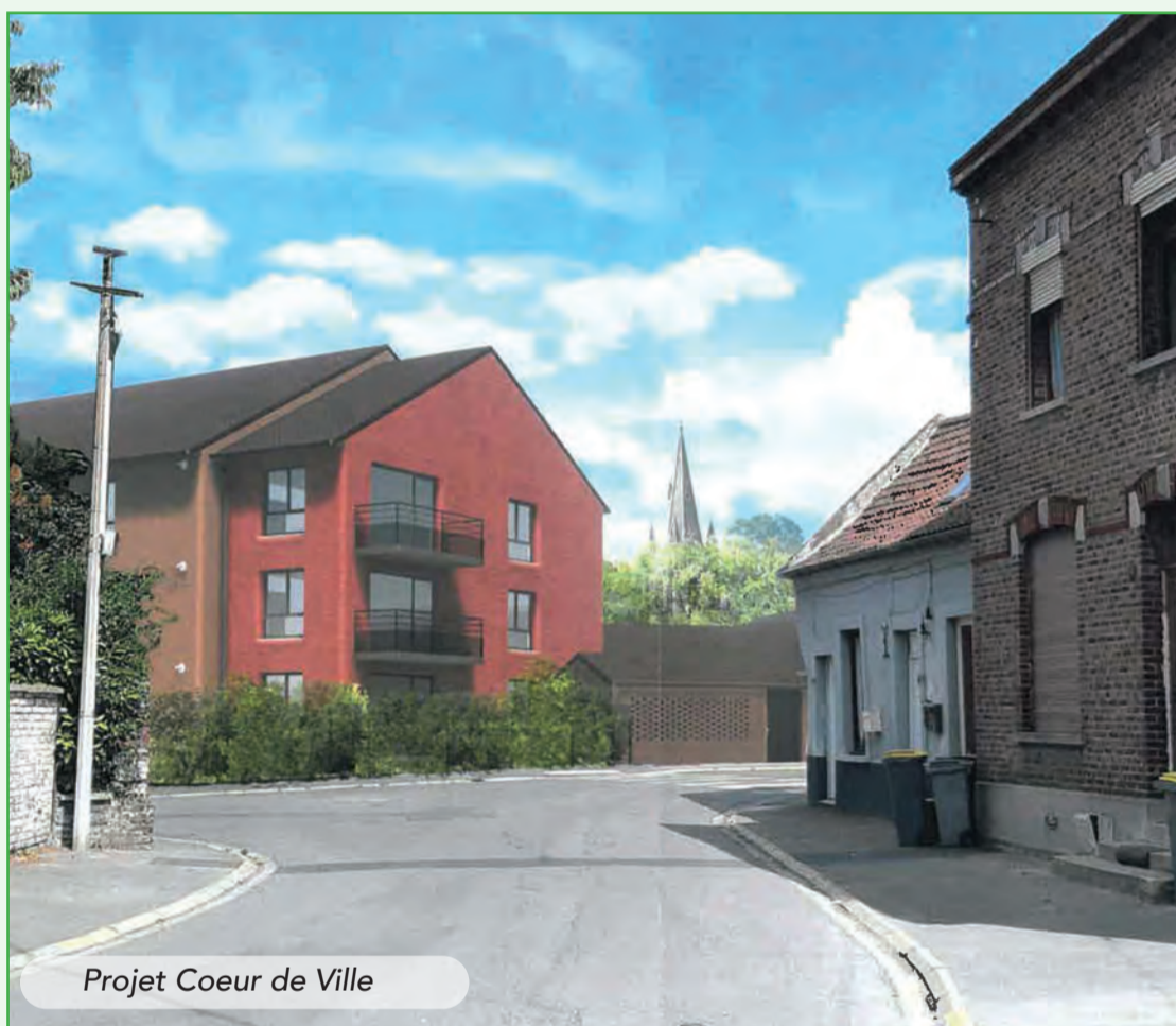
Projet Coeur de Ville