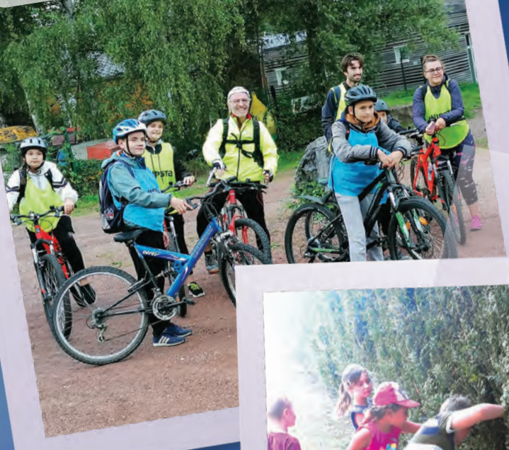
RENDEZ-VOUS ADOS DE L'ÉTÉ : Sortie VTT