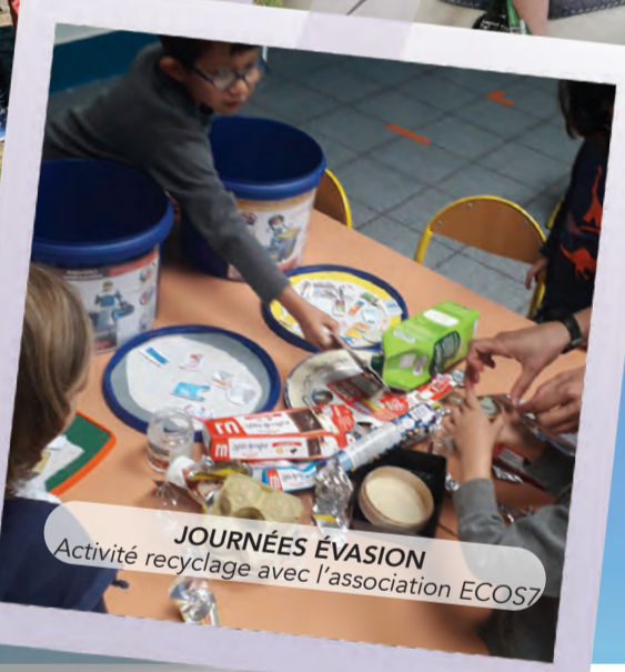
JOURNÉES ÉVASION Activité recyclage avec l'association ECOS7