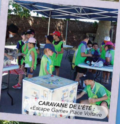
CARAVANE DE L'ÉTÉ : «Escape Game» Place Voltaire