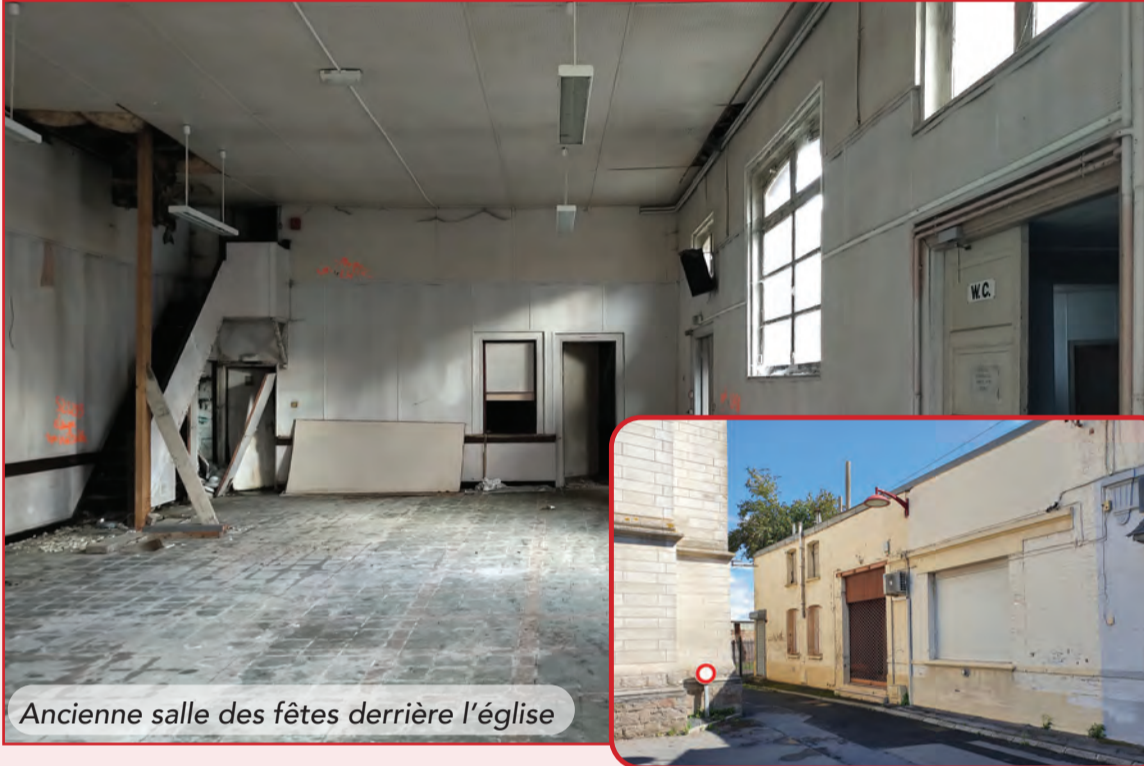
Ancienne salle des fêtes derrière l'église

L'espace de 7000m 2 situé entre la rue Jean Jaurès et la rue Mirabeau est en friche depuis plusieurs années.