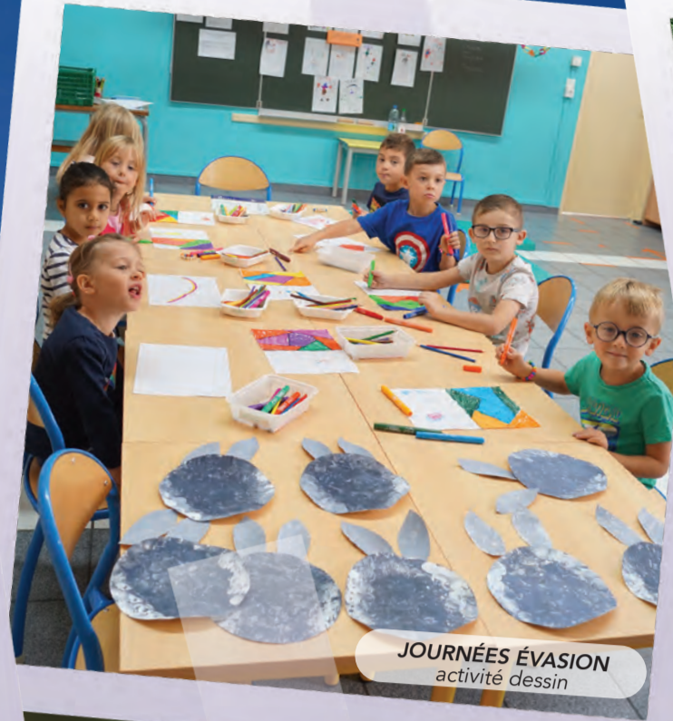
JOURNÉES ÉVASION activité dessin