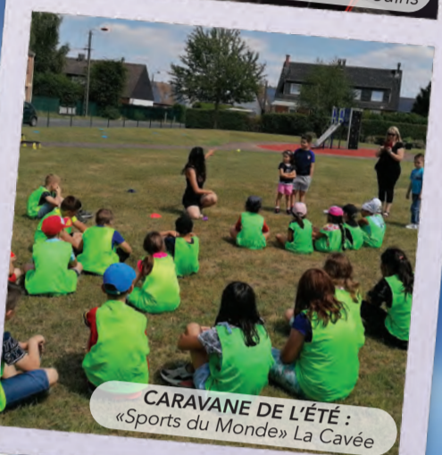
CARAVANE DE L'ÉTÉ : «Sports du Monde» La Cavée