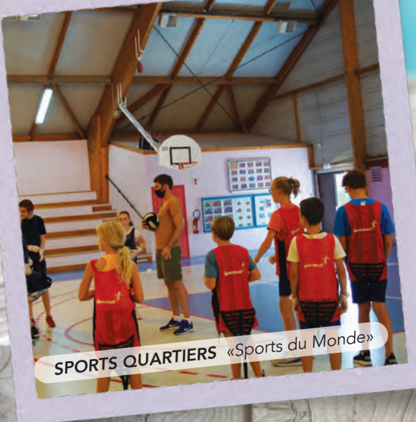
SPORTS QUARTIERS «Sports du Monde»

L'important travail des équipes d'animation pour organiser des accueils de loisirs malgré des contraintes sanitaires a porté ses fruits. Les rires, les activités riches en animations et découvertes ont eu raison d'un début d'année étrange et parfois ennuyant pour les enfants. Ils étaient une centaine à prendre part aux Journées Evasion durant ces deux mois d'été. De quoi oublier un peu le confinement et recharger les batteries avant la rentrée. Gageons qu'ils garderont de beaux souvenirs des moments partagés avec les copains et les copines. Les Sports Quartiers ont également eu leur petit succès avec une quarantaine d'enfants inscrits durant 6 semaines. Au programme, des intervenants pour partager le plaisir de l'activité sportive avec l'A.S.A.O pour une marche nordique, T'es cap le handicap, un grand défi Last Dance puis sur la thématique Sports du monde et enfin une sortie VTT et Initiation base-ball avec le club de Valenciennes. La Caravane de l'été faisant étape chaque mercredi dans les quartiers durant deux mois a reçu la visite de plusieurs dizaines de petits onnaingois pour des animations drôles et enrichissantes.