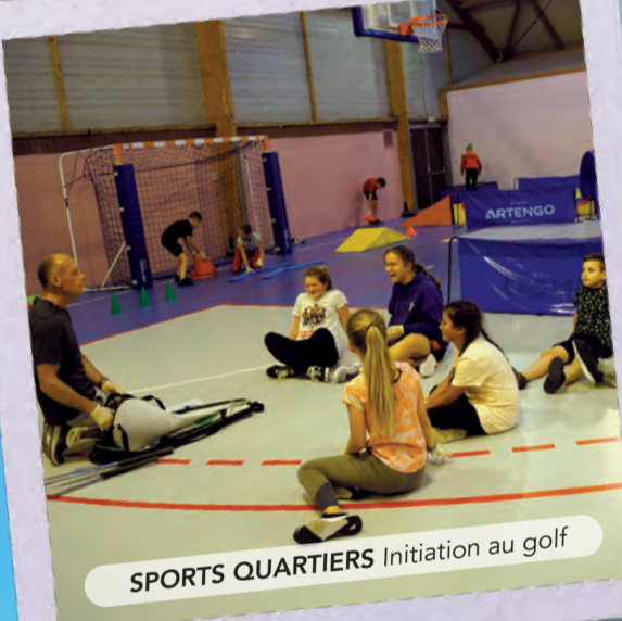
SPORTS QUARTIERS Initiation au golf