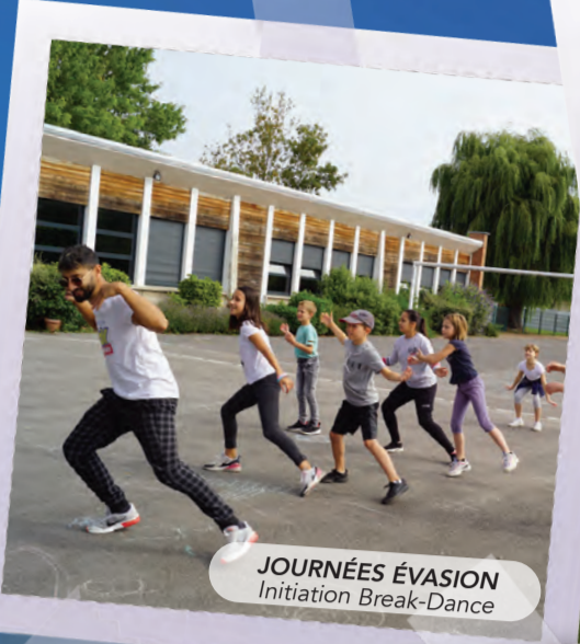
JOURNÉES ÉVASION Initiation Break-Dance