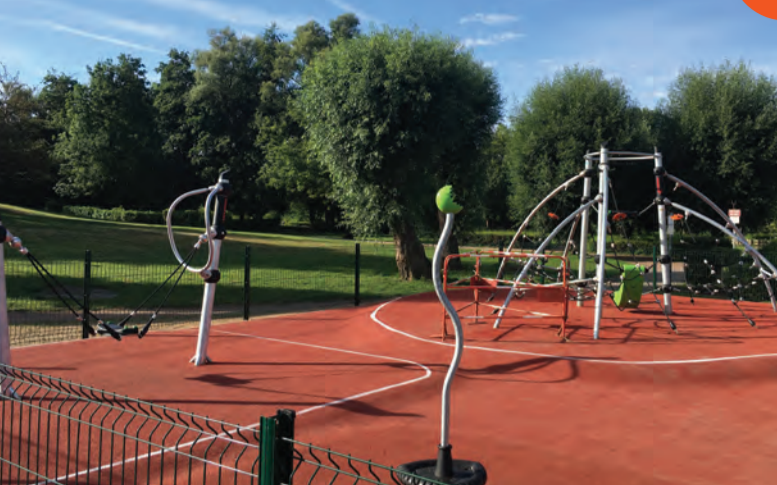
Création et extension de l'aire de jeux au Parc (6-12 ans)

Comme elle s'y était engagée, malgré les échéances électorales et la crise sanitaire l'équipe municipale a poursuivi et poursuit toujours l'avancement des projets. Les opérations en cours ou réalisables immédiatement ont été lancées. La redynamisation d'Onnaing avance à grands pas.