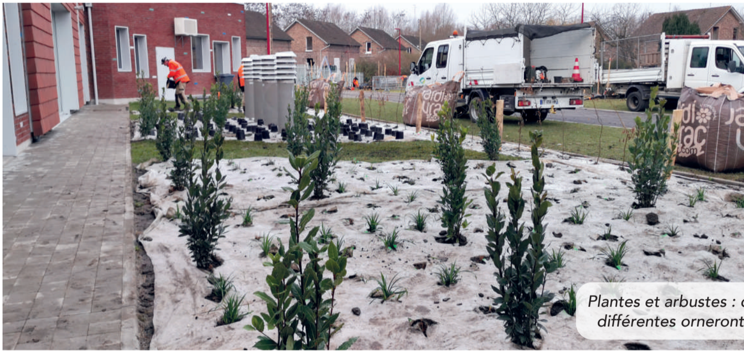
Plantes et arbustes : des dizaines d'essences différentes orneront les abords de l'école.