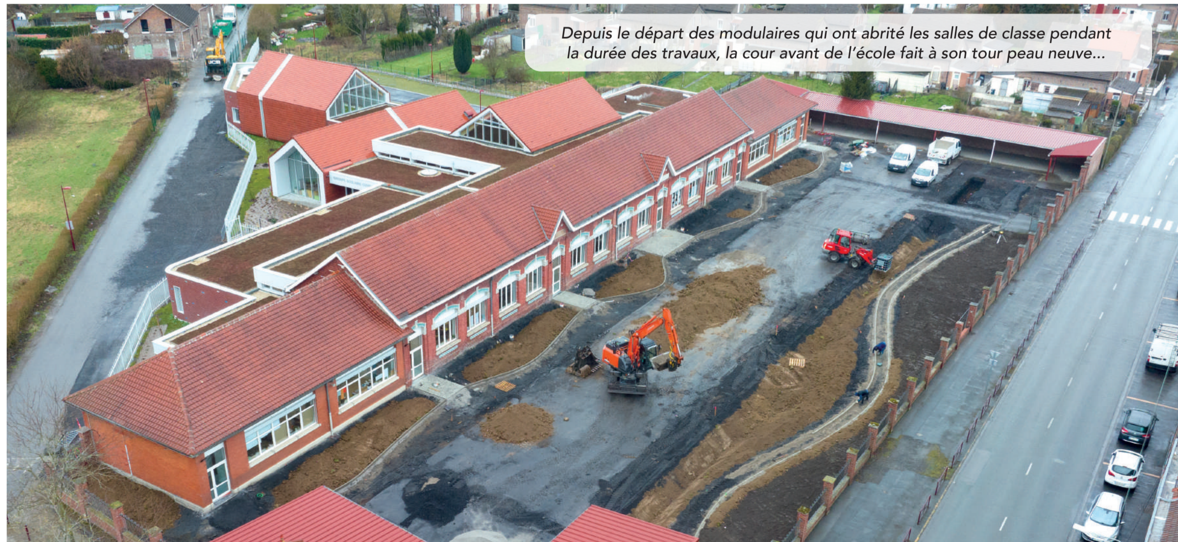
Depuis le départ des modulaires qui ont abrité les salles de classe pendant la durée des travaux, la cour avant de l'école fait à son tour peau neuve...