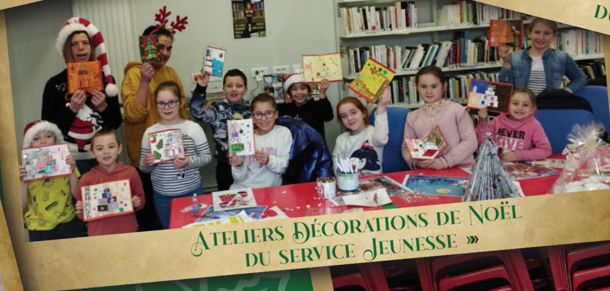
ATELIERS DÉCORATIONS DE NOËL DU SERVICE JEUNESSE »