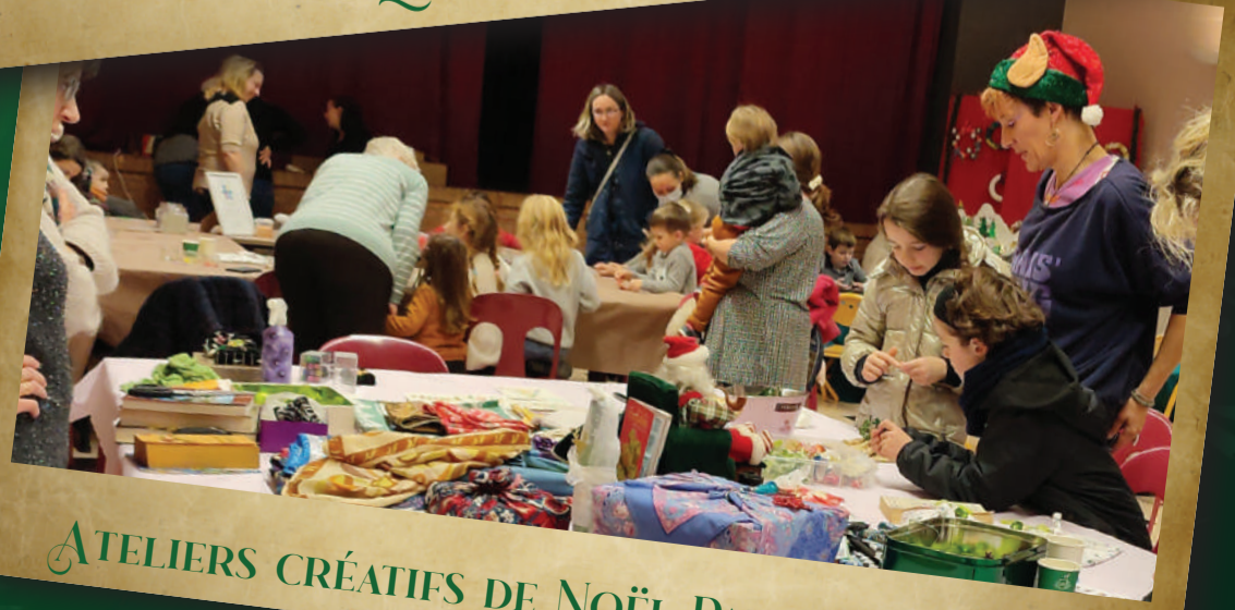
ATELIERS CRÉATIFS DE NOËL PARENTS - ENFANTS