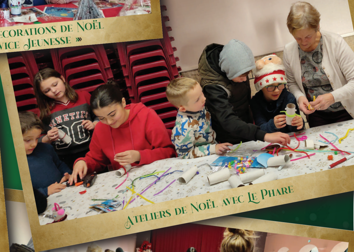
ATELIERS DE NOËL AVEC LE PHARE