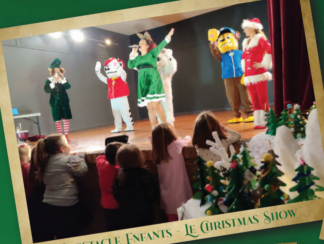
SPECTACLE ENFANTS - LE CHRISTMAS SHOW