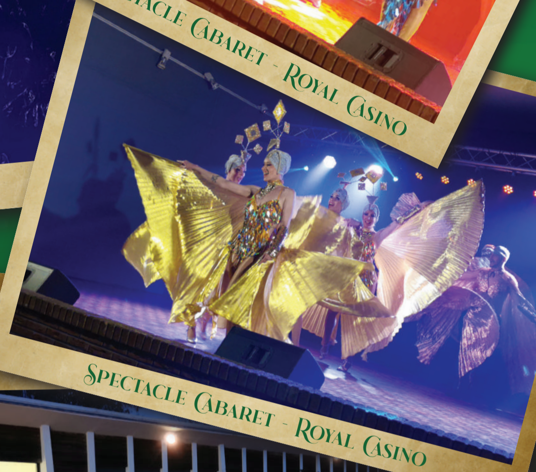
SPECTACLE CABARET - ROYAL CASINO