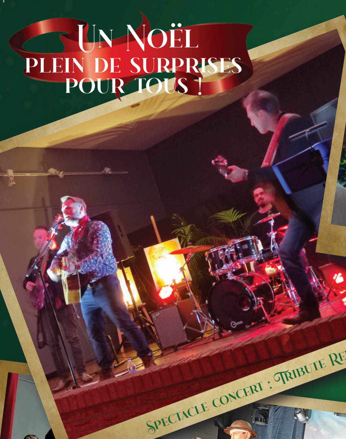
SPECTACLE CONCERT : TRIBUTE RENAUD