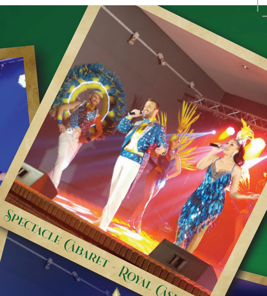
SPECTACLE CABARET - ROYAL CASINO