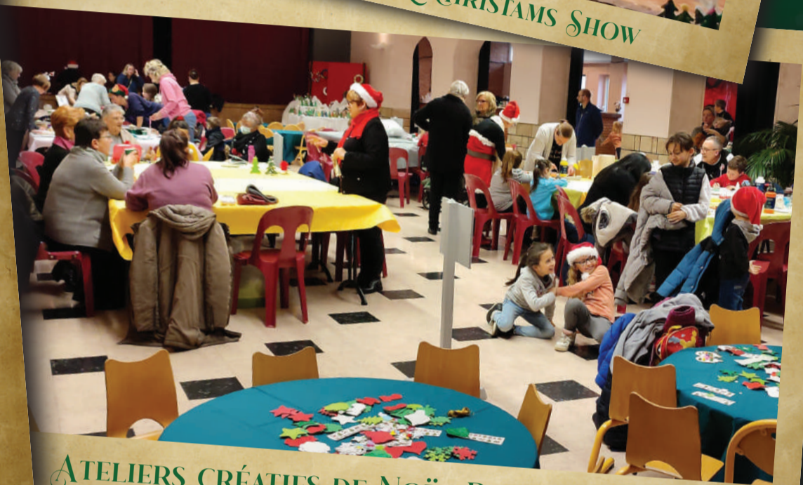
ATELIERS CRÉATIFS DE NOËL PARENTS - ENFANTS