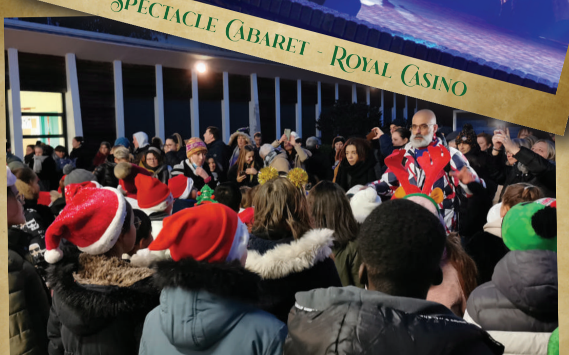
MARCHÉS DE NOËL DANS LES ÉCOLES