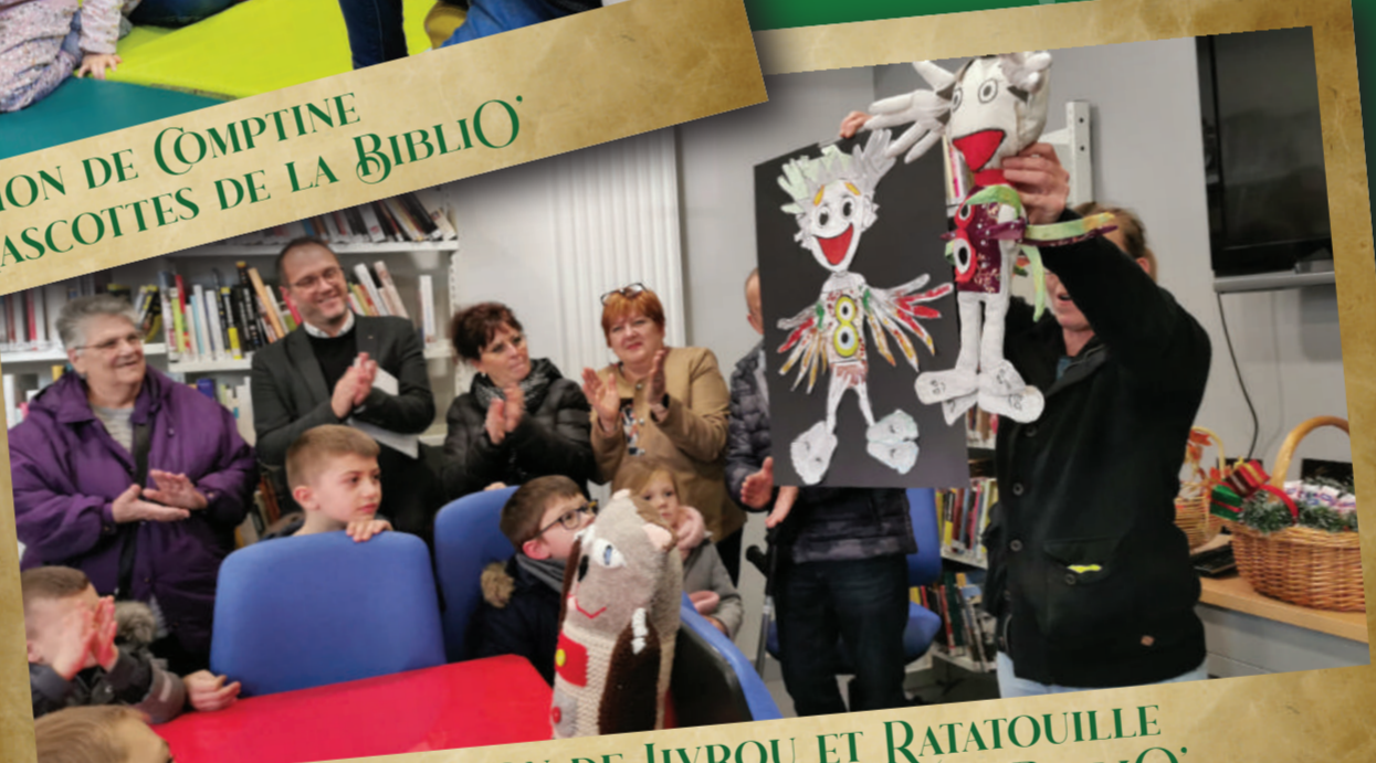
PRÉSENTATION DE LIVROU ET RATATOUILLE DEUX DES TROIS MASCOTTES DE LA BIBLIO