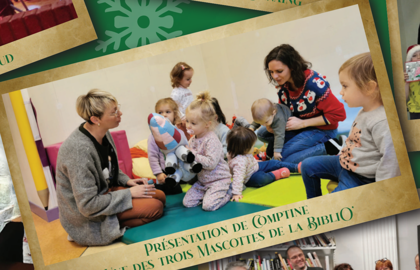
PRÉSENTATION DE COMPTINE UNE DES TROIS MASCOTTES DE LA BIBLIO