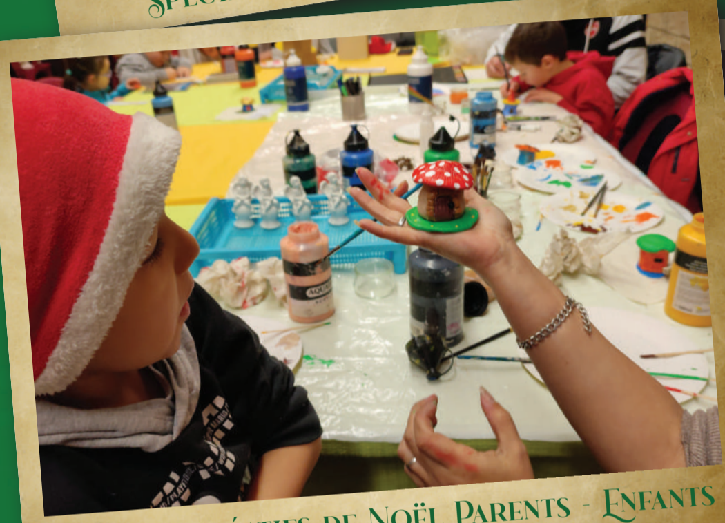
ATELIERS CRÉATIFS DE NOËL PARENTS - ENFANTS