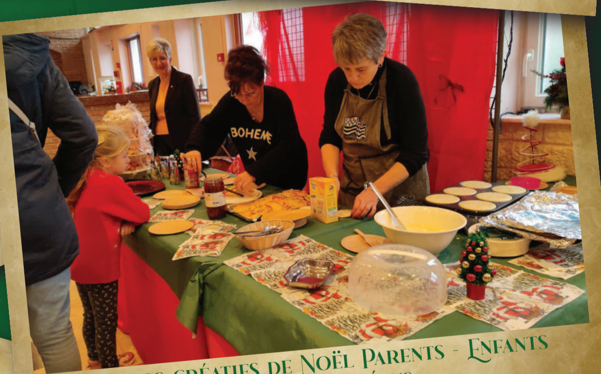
ATELIERS CRÉATIFS DE NOËL PARENTS - ENFANTS LE GOÛTER DES ÉLUS