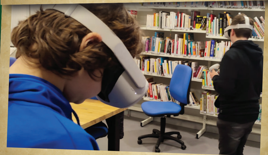
ATELIERS RÉALITÉ VIRTUELLE À LA CYBERBASE