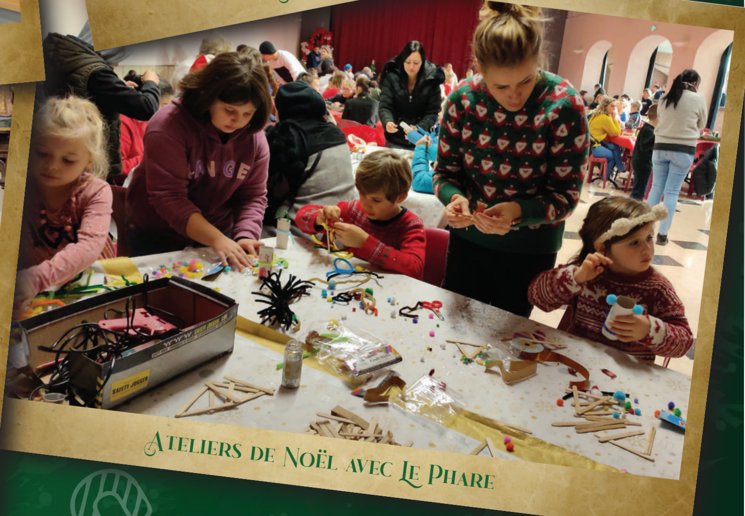
ATELIERS DE NOËL AVEC LE PHARE