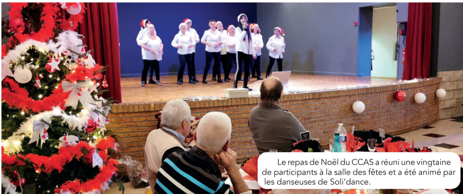
Le repas de Noël du CCAS a réuni une vingtaine de participants à la salle des fêtes et a été animé par les danseuses de Soli'dance.