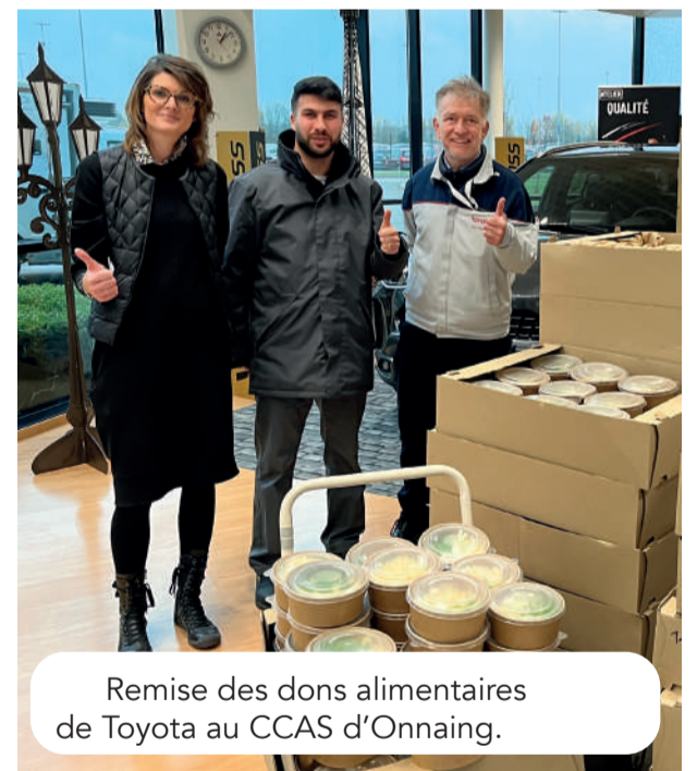
Remise des dons alimentaires de Toyota au CCAS d'Onnaing.