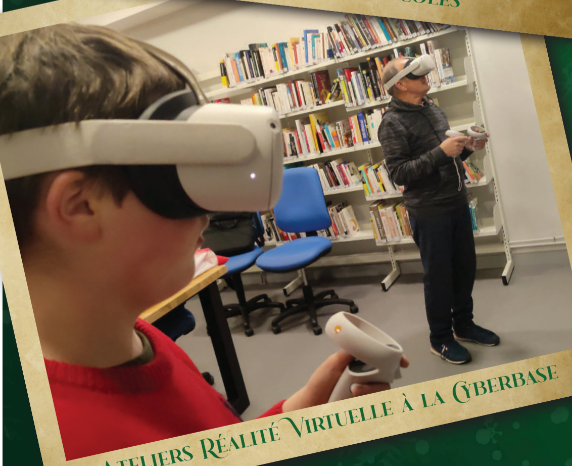
ATELIERS RÉALITÉ VIRTUELLE À LA CYBERBASE