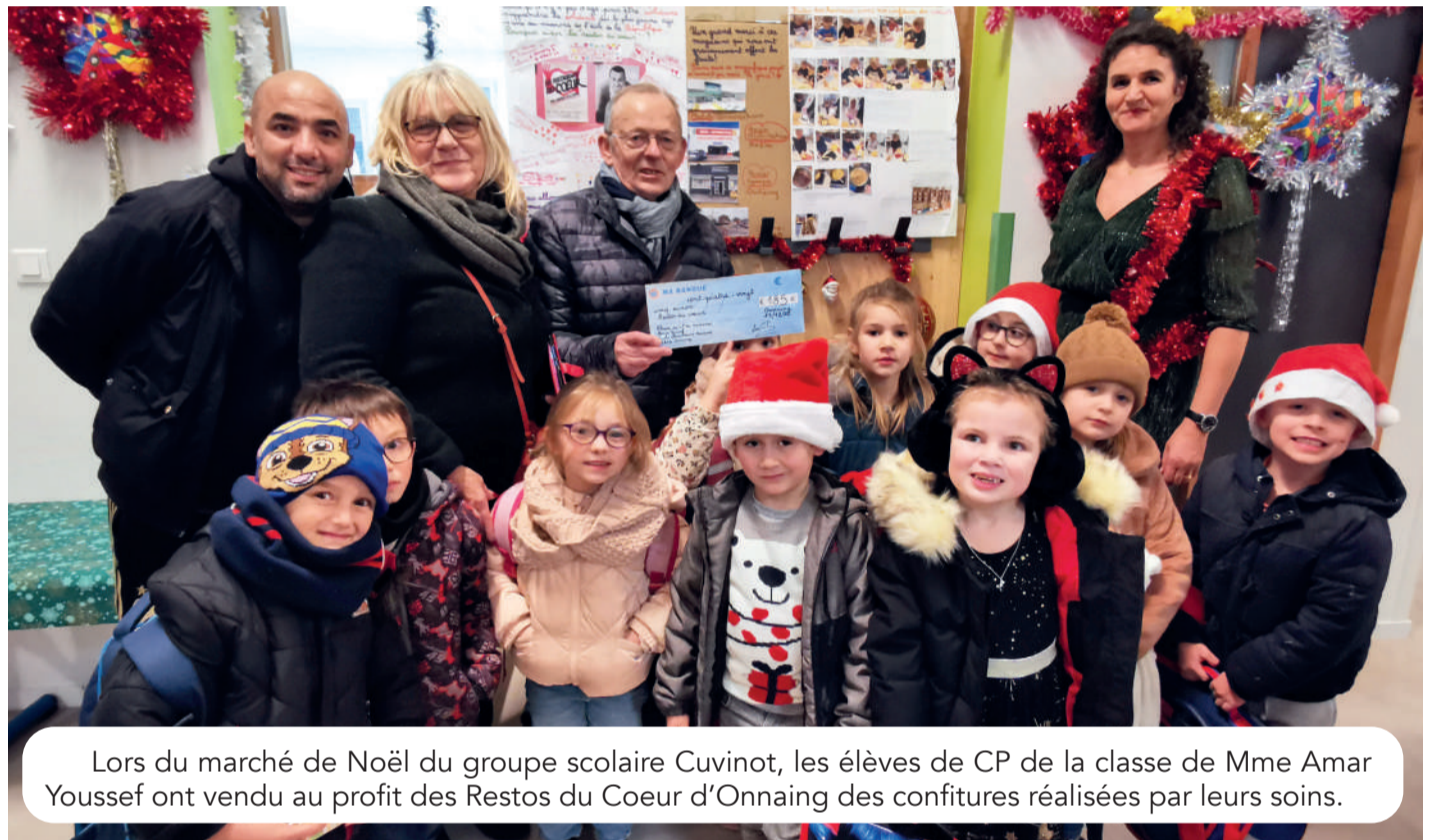
Lors du marché de Noël du groupe scolaire Cuvinot, les élèves de CP de la classe de Mme Amar Youssef ont vendu au profit des Restos du Coeur d'Onnaing des confitures réalisées par leurs soins.