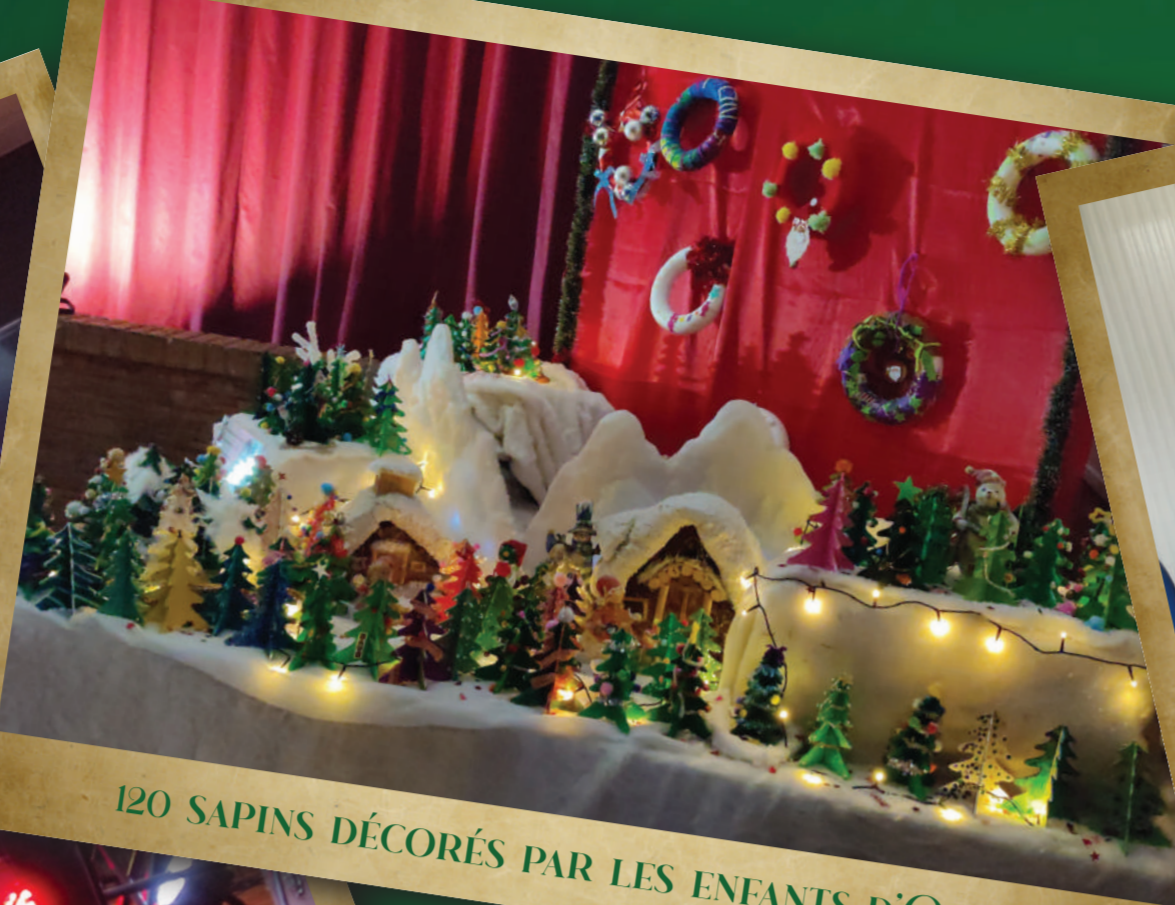
120 SAPINS DÉCORÉS PAR LES ENFANTS D'ONNAING