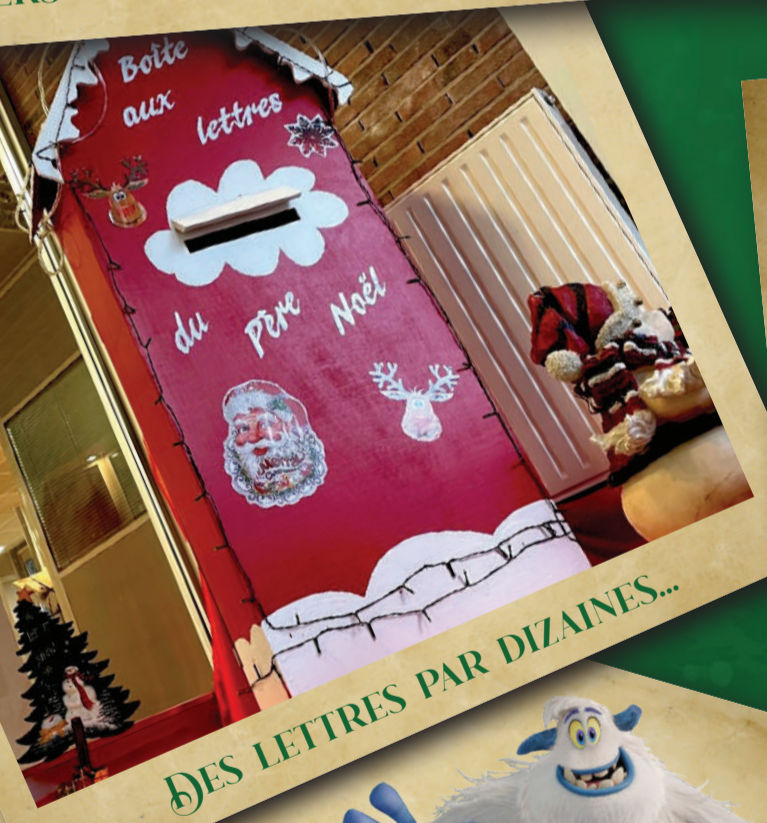
DES LETTRES PAR DIZAINES...