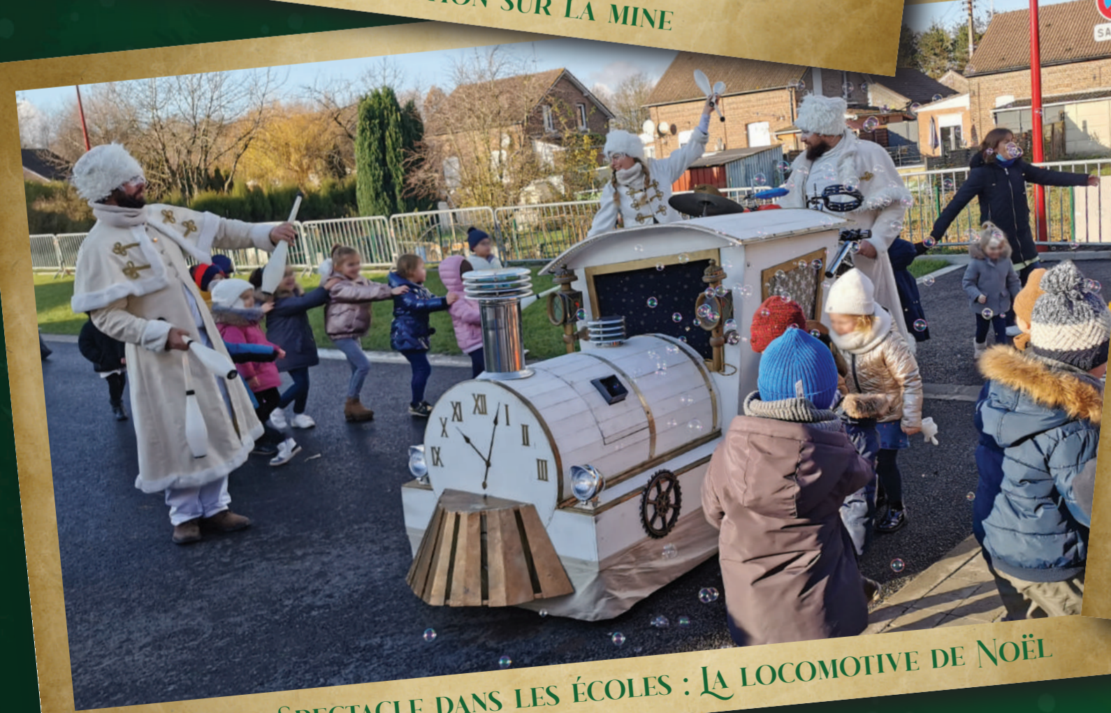
SPECTACLE DANS LES ÉCOLES : LA LOCOMOTIVE DE NOËL