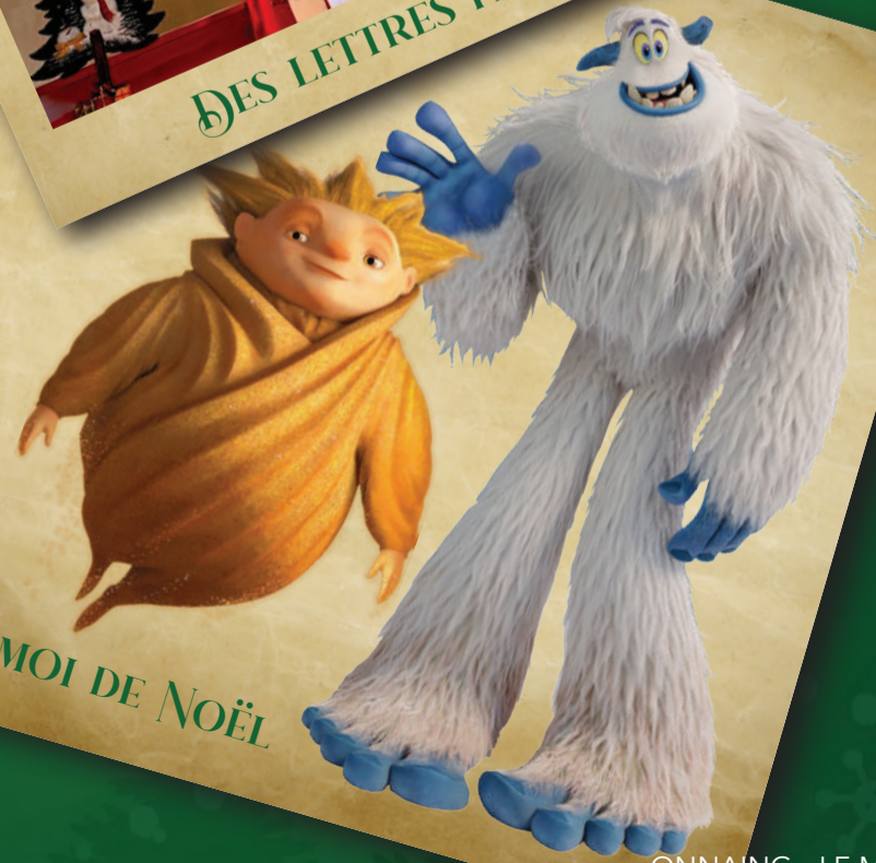
CINÉMOI DE NOËL