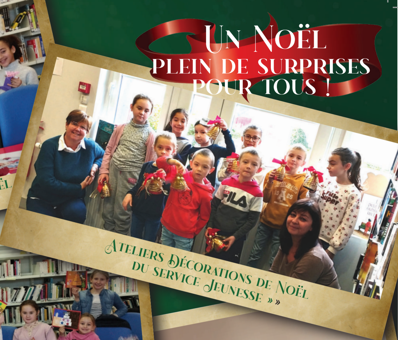
ATELIERS DÉCORATIONS DE NOËL DU SERVICE JEUNESSE »