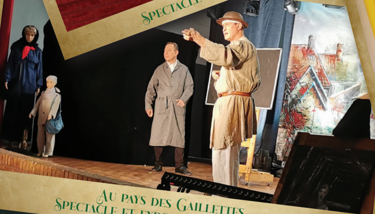
AU PAYS DES GAILLETIES SPECTACLE ET EXPOSITION SUR LA MINE