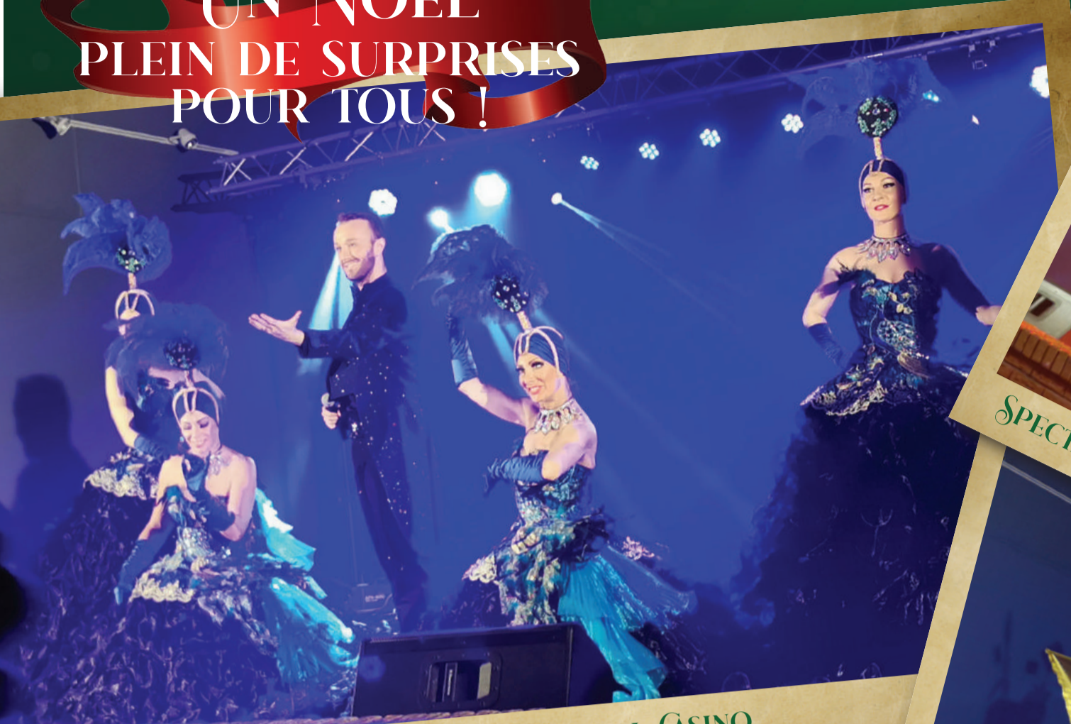
SPECTACLE CABARET - ROYAL CASINO