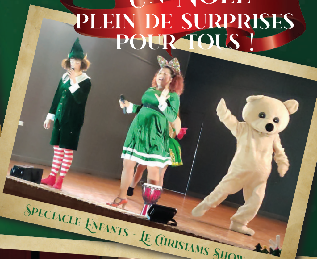
SPECTACLE ENFANTS - LE CHRISTMAS SHOW