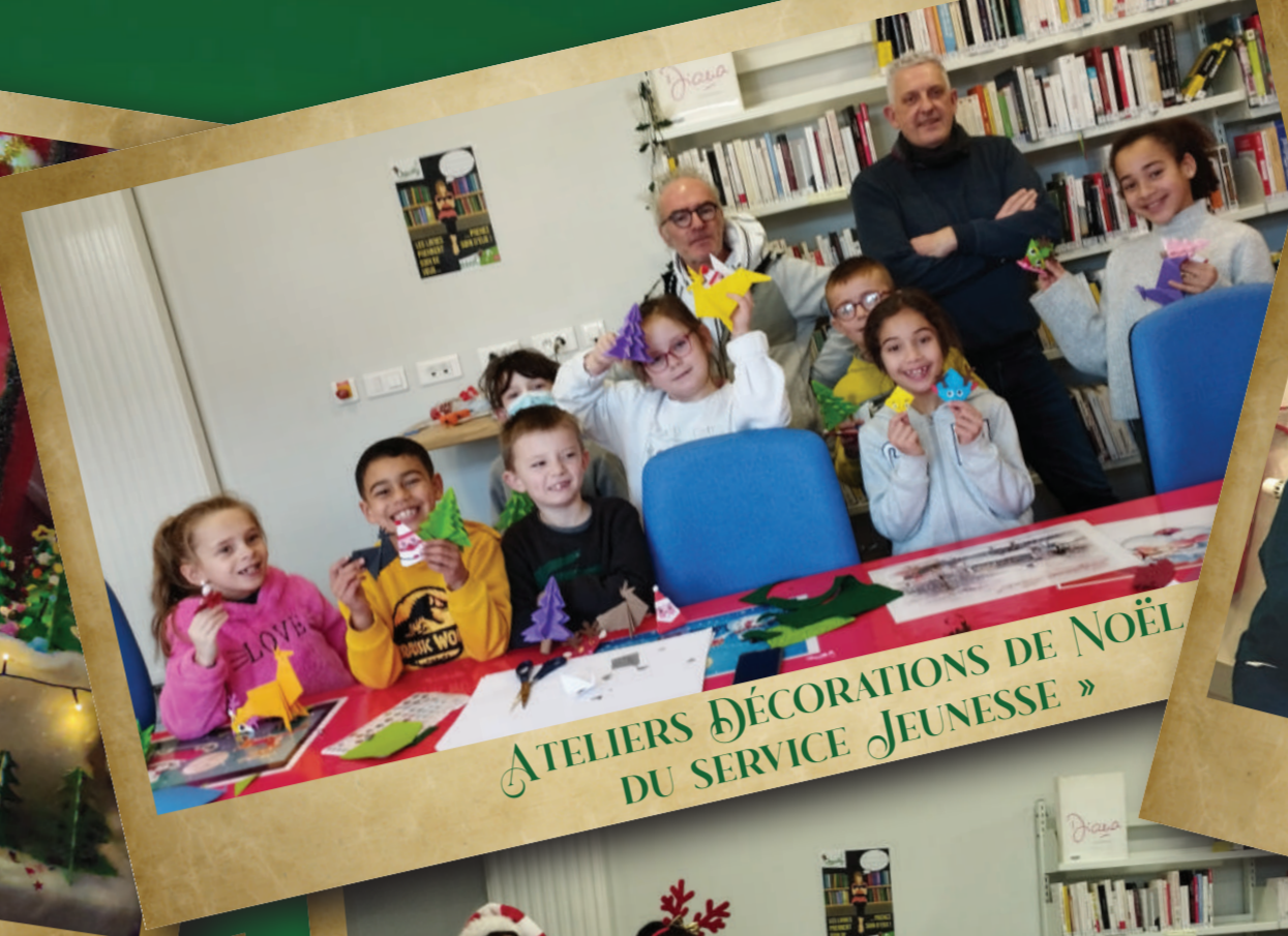
ATELIERS DÉCORATIONS DE NOËL DU SERVICE JEUNESSE »