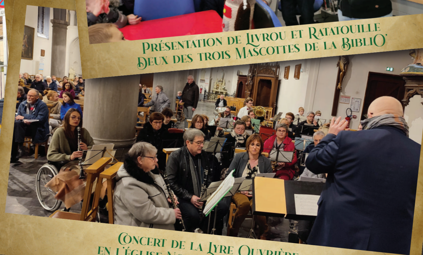
CONCERT DE LA LYRE OUVRIÈRE EN L'ÉGLISE NOTRE DAME DES GRÂCES