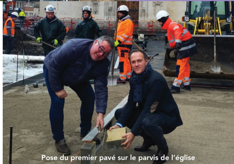
Pose du premier pavé sur le parvis de l'église

POUR VOTRE SÉCURITÉ ET CELLE DES OUVRIERS SUR LE CHANTIER, SOYEZ VIGILANT ET OBSERVEZ BIEN LES PANNEAUX DE CIRCULATION.