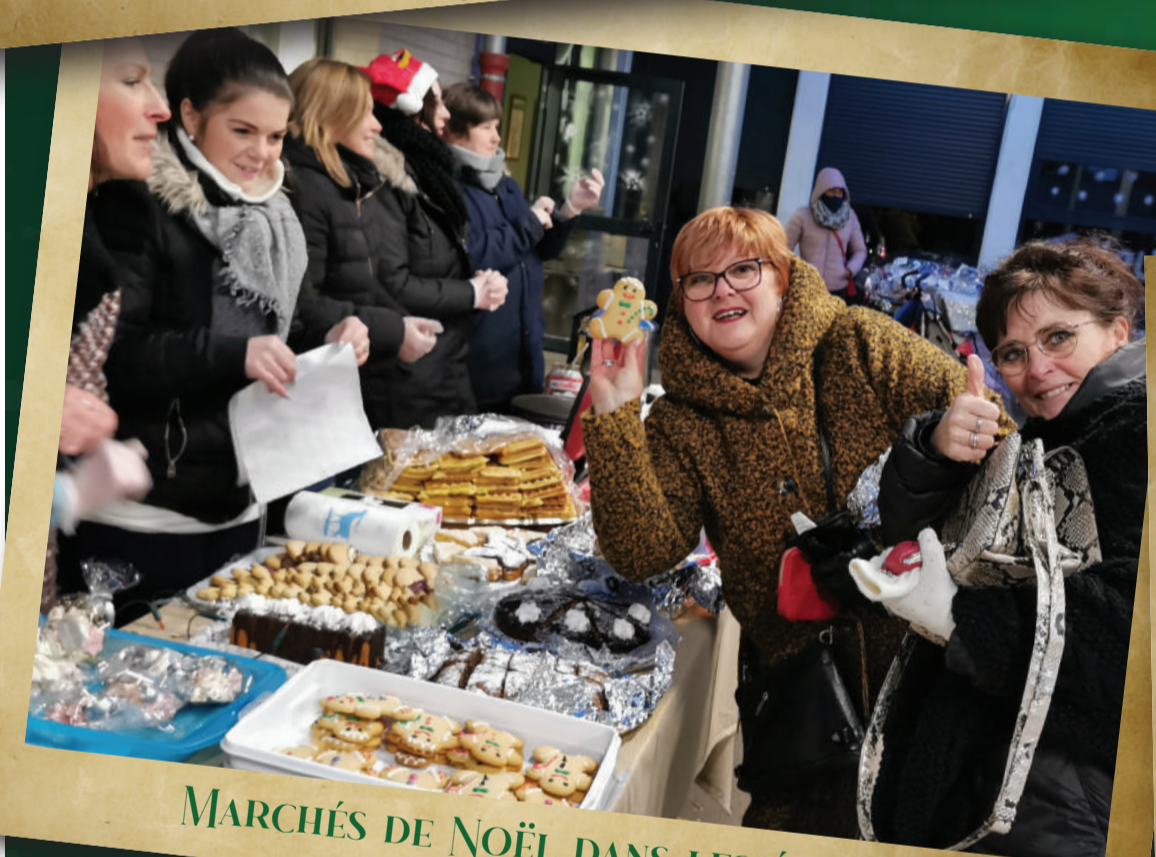
MARCHÉS DE NOËL DANS LES ÉCOLES