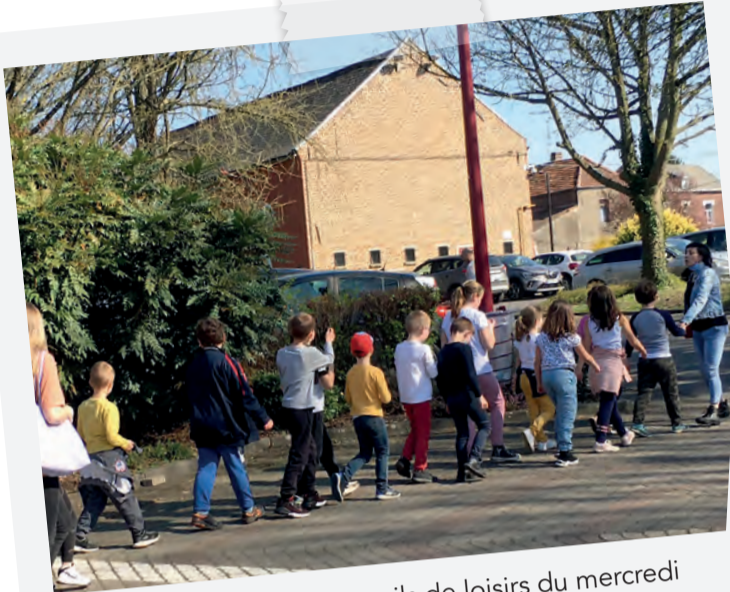
Les enfants des accueils de loisirs du mercredi ont pris part à l'événement, les tout-petits réalisant une toute petite marche...