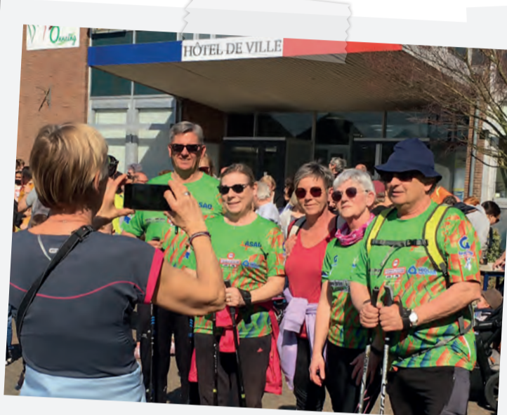
Les associations Onnaing Marche et ASAO ont encadré chacun des deux parcours de 6 et 8 km.