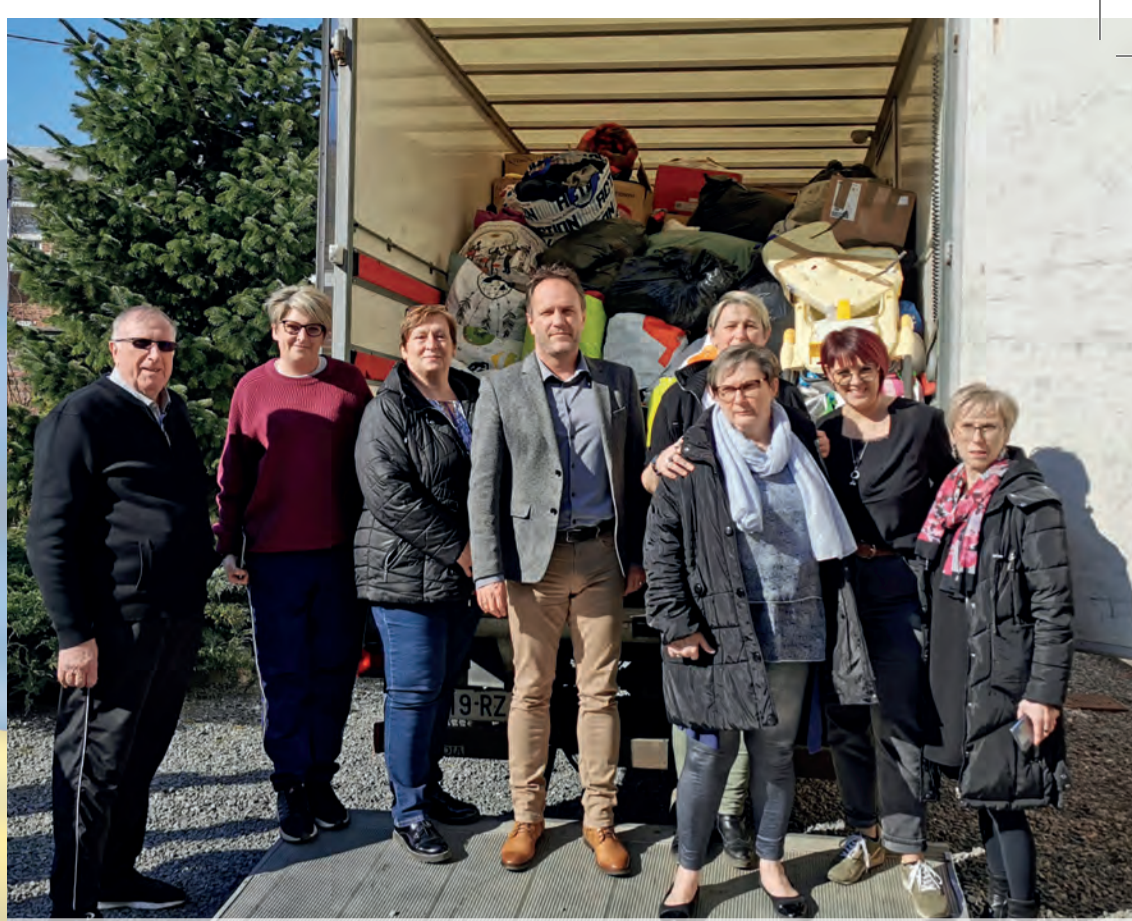
Les dons collectés par l'ACCO ont ensuite été acheminés par la Ville jusqu'à la Protection Civile.

La Municipalité remercie sincèrement les entreprises de la Zone Venot : ATF, Supply, GSF, 3MI, TMF OCAD et TRACE, pour leur réactivité et leurs dons conséquents.