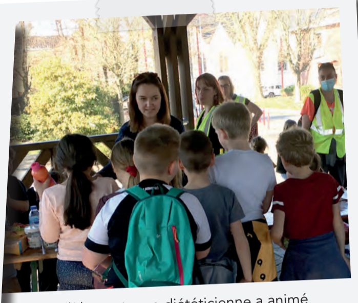
Parallèlement, une diététicienne a animé un atelier sur les bonnes habitudes alimentaires.